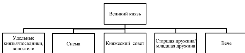
Рис. 1. Система власти в Древнерусском государстве

Государственный строй. В Древнерусском государстве властные функции осуществляли: великий киевский князь, княжеский совет, съезды удельных князей (снемы), представители княжеской власти на местах, вече, после принятия христианства в 988 г. – церковные иерархи в рамках своей компетенции (рис. 1).